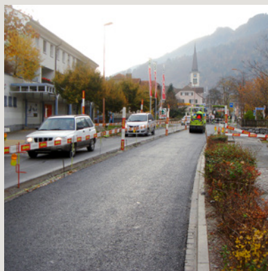
GESAMTSANIERUNG SARGANSER- STRASSE, BAD RAGAZ Baujahr 2011-2014 Bausumme Fr. 2.5 Mio.