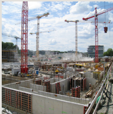
ÜBERBAUUNG RICHTI-AREAL BAUFELDER 3-5, WALLISELLEN Baujahr 2011-2013 Bausumme Fr. 200 Mio.