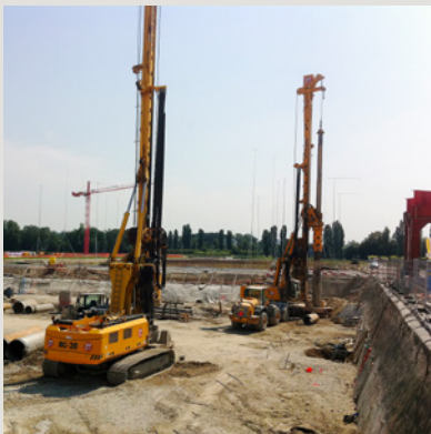
WOHN-GESCHÄFTSHAUS WRIGHT-PLACE, OPFIKON Baujahr 2012-2014 Bausumme Fr. 140 Mio.