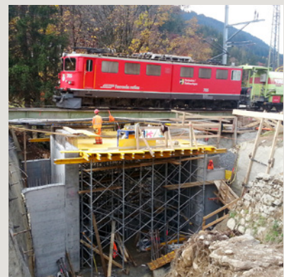
DOPPELSPURAUSSBAU RHB, KLOSTERS Baujahr 2013-2014 Bausumme Fr. 1.5 Mio.