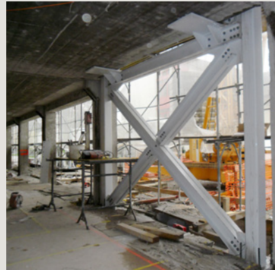
SCHULHAUS HUNGERBÜHL EMBRACH Baujahr 2011 Bausumme Fr. 6.5 Mio.