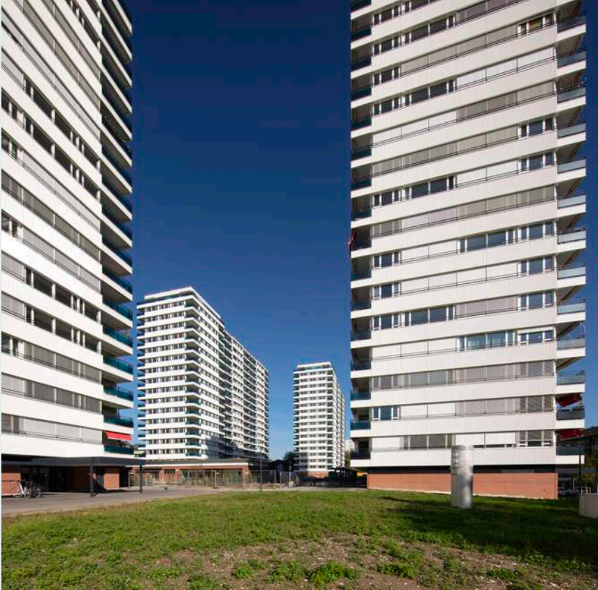
Hochhäuser Albanteich Basel