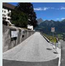
Strassen und Plätze