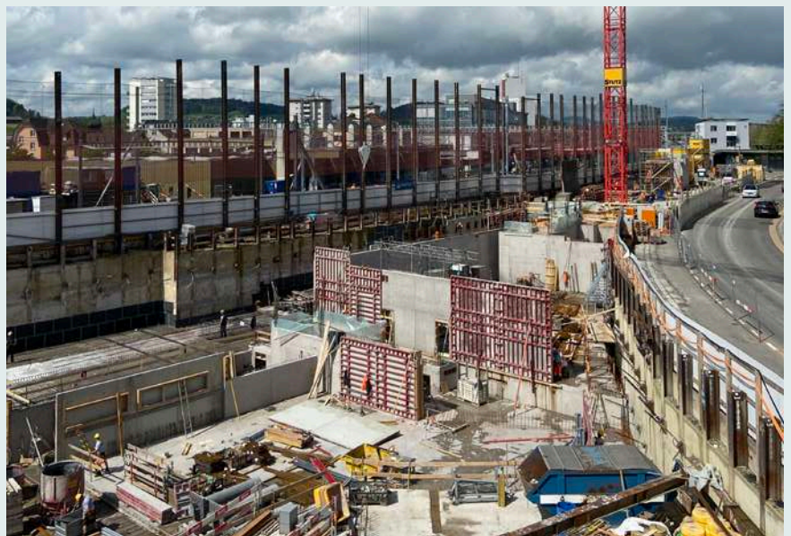
WÜB Perronimo Wil